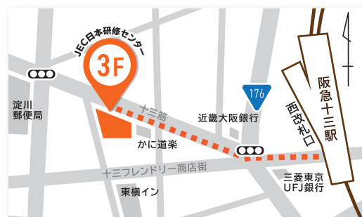
JEC日本研修センター 十三 阪急電鉄十三駅西口から徒歩3分