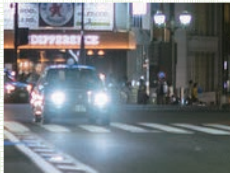
イメージ図1 「正常な視界」