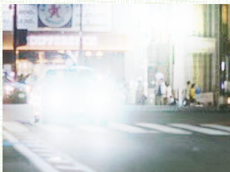
イメージ図2 「眩しく見える」

暗点や歪み、視野欠損は一般的に重大な網膜疾患や神経疾患が絡んでいることが多く、特に注意が必要です。患者様には眼科受診を勧めることが無難と考えます。また疾患が慢性的なのか急性性的なのかによっても変わります。このように愁訴をゆつくり聞くだけで、ある程度の判別は可能です。