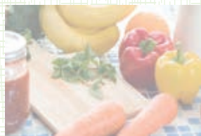
イメージ図2 「白く霞んで見える」