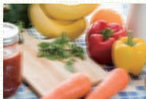
イメージ図3 「ぼやけて二重に見える」

様々なタイプの見え方の障害があるため、これらを細かく検査・診察する必要があります。また片目だけが白内障の