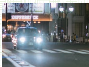
イメージ図 「正常な視界」