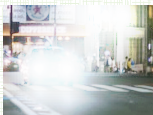
イメージ図4 「眩しく見える」