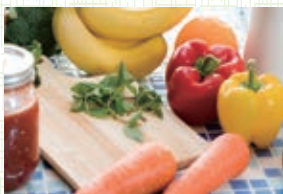
イメージ図 「正常な視界」